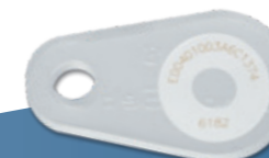
IDXtriangel Für Rundschlingengehänge, Ketten und Stahlseile.