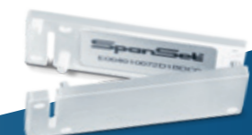
IDXclip Für Hebebänder und Rundschlingen.