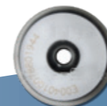
IDXdome Für hochwertige metallische Produkte.